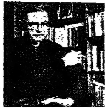
سارن : الجيم